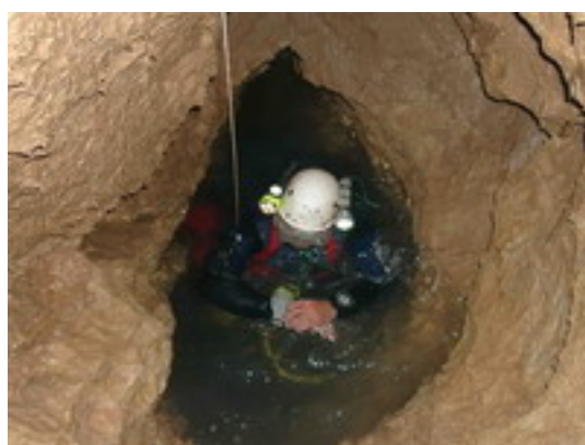
Varias Chapi. Autor Diego Mendoza