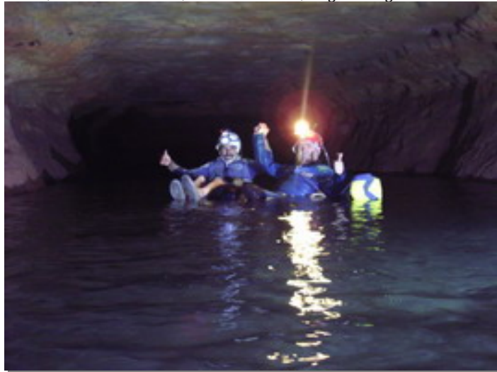
WinTimdouine. Primer lago