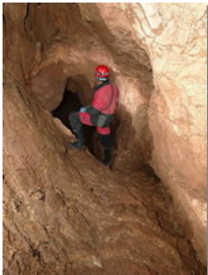
5 Chapi. Galeria. Autor: Diego Mendoza

A finales de Septiembre, el grupo Karst, ayudado por miembros de los grupos GEAG, GESUB, CES, GIEX, GEAC. ha realizado dos inmersiones en uno de los sifones terminales de la Surgencia de Chapi, concretamente en las galerías inferiores de la Cavidad. Estas inmersiones han constatado la continuidad de la cavidad por las galerías sumergidas. Se han podido explorar más de cincuenta metros de galería inundada y siete de profundidad, hasta una gatera que detuvo la progresión, confirmando no obstante que la galería continúa con buen tamaño tras este paso.