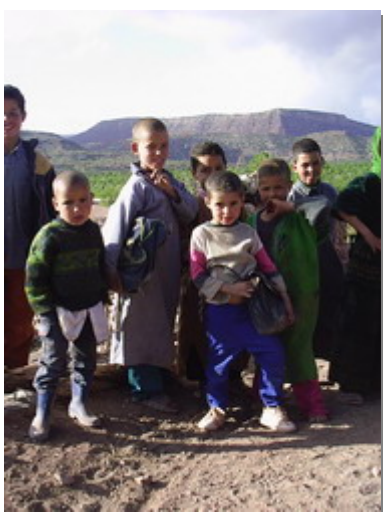
Niños de Tamlalt