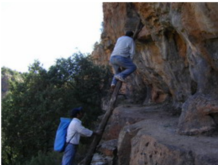
Entrada a cueva de Ifou