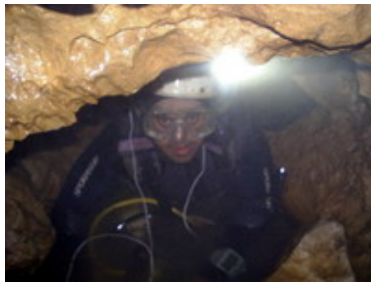
3 Sima del Pilón. Sifón