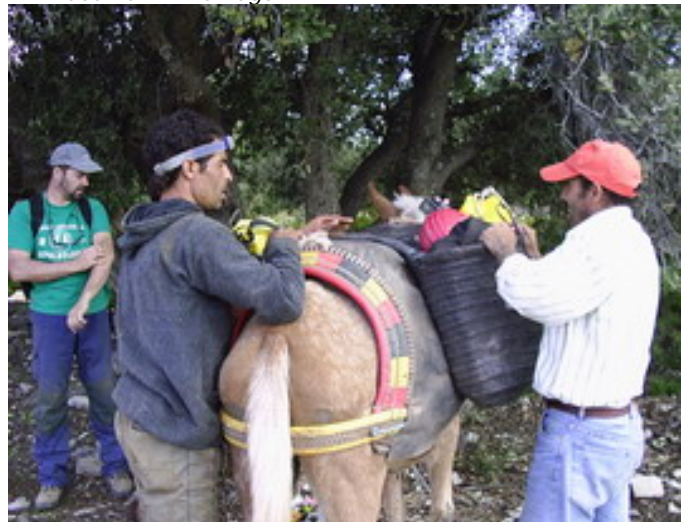
Porteo de material en "Le Plateau"