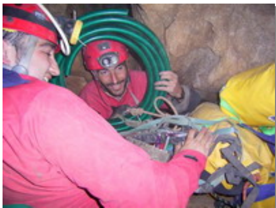
4 Sima del Pilon. Transporte. Antonio J. Moreno

Se ha reinstalado toda la cavidad con parabolos de 10 mm. Sustituyendo a la existente de Spits. Se han realizado escaladas en algunos techos buscando continuidad sin resultados positivos. Se ha explorado igualmente una nueva vía que tras descender unos metros se vuelve impenetrable y por último se ha realizado una inmersión en el sifón terminal, compuesto por una estrecha diaclasa inundada. En el sifón se han podido descender seis metros deteniéndose la exploración en un paso impenetrable. Con estos trabajos se considera concluida la exploración de la Sima, quedando solo pendiente acabar el levantamiento topográfico de las nuevas zonas exploradas. La profundidad total estimada, a falta de acabar la topo es de 109 metros.